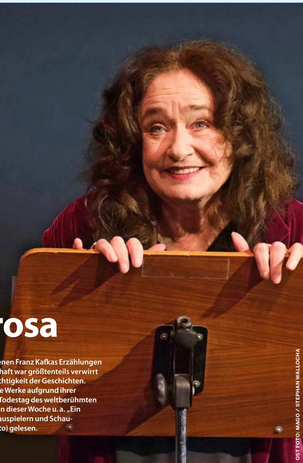
OST FOTO: MAGO / STEPHAN WALLOCHA